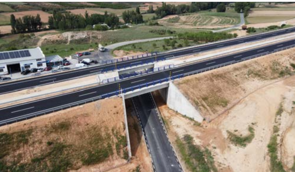
Paso sobre la carretera SO-P-5006.