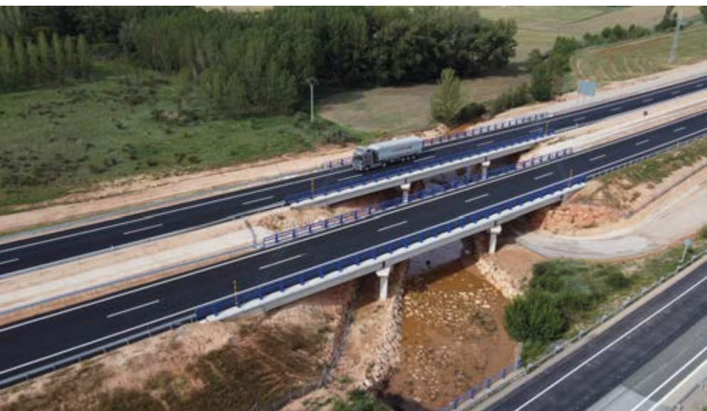
Viaducto sobre el arroyo Torderón.