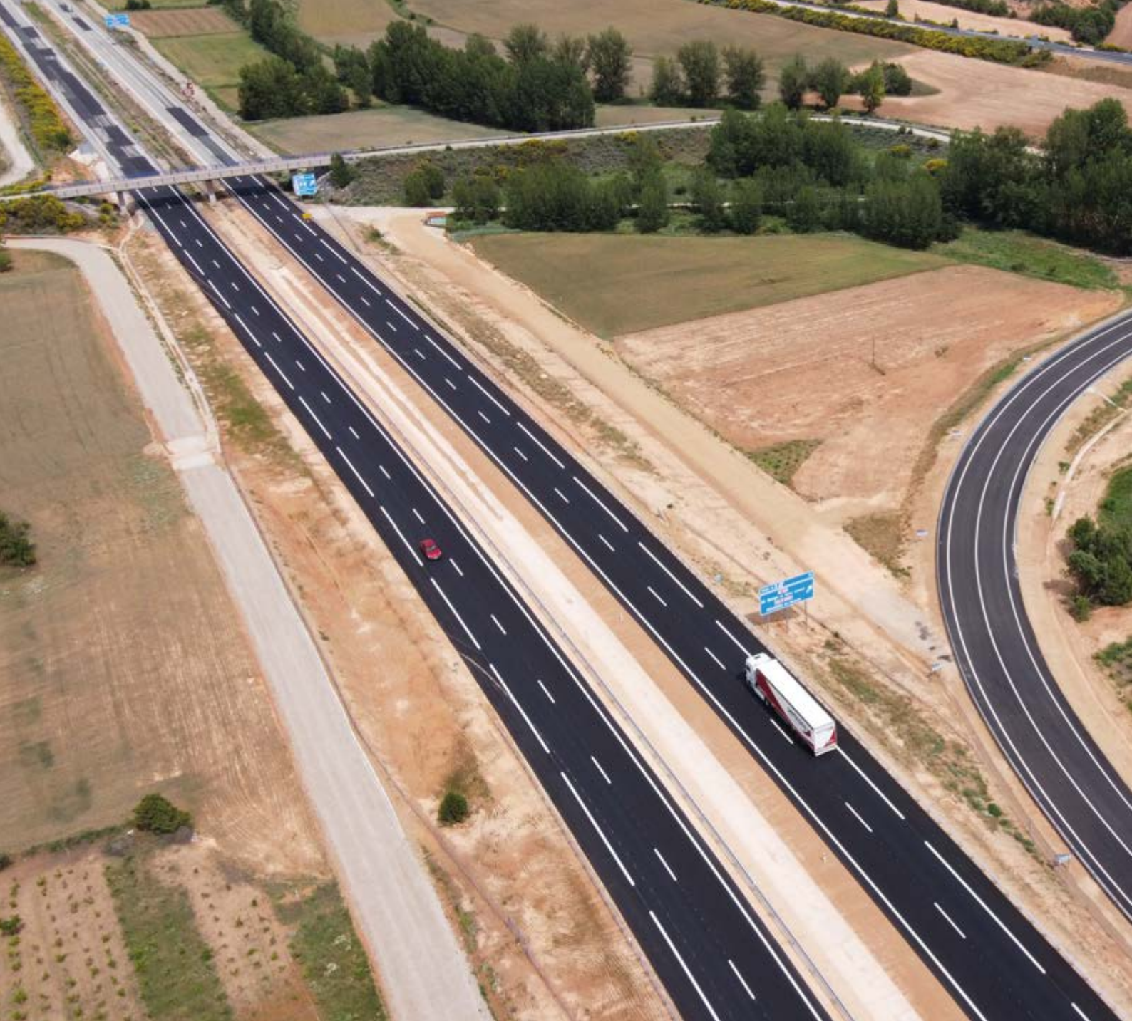
Autovía A-11 e integración del itinerario alternativo (N-122).

Osma-Enlace de San Esteban de Gormaz (Oeste), que constituye el penúltimo esfuerzo para completar el corredor Soria-Aranda de Duero de la A-11, con 120 km, a falta tan solo de dos tramos en ambos extremos. Con una longitud de 9,2 km, este tramo, al permitir la continuidad con otros tramos en servicio de esta infraestructura, ha generado un itinerario continuo de gran capacidad de 62 km en la provincia de Soria.