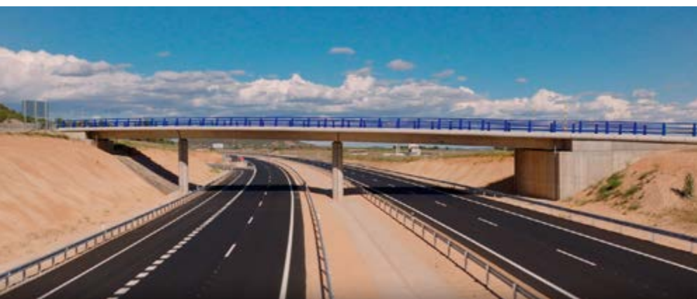
Paso superior del enlace de San Esteban de Gormaz.

Para los trabajos de desmonte en la zona denominada Cabeza de Perro se ha empleado un método de voladuras especial destinado a evitar afecciones a la cercana localidad de San Esteban de Gormaz, declarada conjunto histórico artístico. Parte de su casco urbano está asentado en esta formación montañosa, con riesgo de desprendimiento en zonas como la Peña Magdalena, y en el pasado, a raíz de la construcción mediante detonaciones de la variante de San Esteban de Gormaz de la N-122, hubo algún desprendimiento en esta estribación. Para evitar los riesgos que pudiera conllevar para el pueblo ejecutar voladuras convencionales sin realizar actuaciones de seguridad complementarias, un modificado al proyecto introdujo un nuevo procedimiento de voladuras controladas que incluyó estudios de los parámetros de la vibración y el empleo de equipos para monitorizar los posibles movimientos de Peña Magdalena durante las detonaciones. Estos trabajos se completaron sin contratiempos.