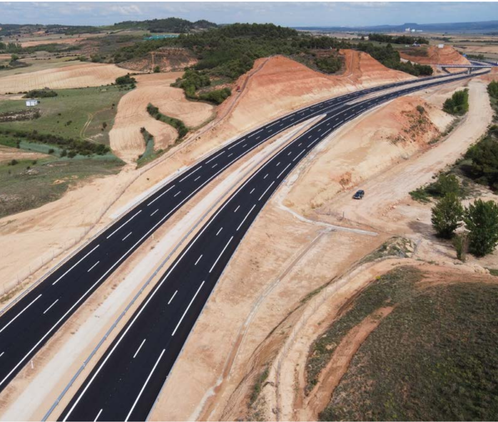
La A-11 a su paso por la zona de Castro Moros, vista hacia Soria.

dad Media Diaria) prevista en 2023 es de 7085 vehículos, de ellos una cuarta parte pesados.