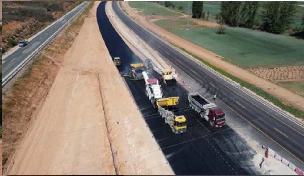
Extendido de la capa de rodadura.