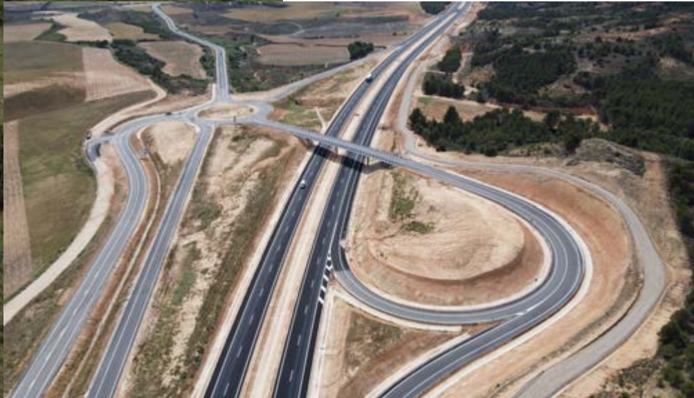
Enlace de San Esteban de Gormaz (Este).

a cargo de Acciona Ingeniería. Su construcción se ha dilatado en el tiempo debido a una conjunción de factores externos producidos desde la adjudicación, entre ellos la crisis económica, el concurso de acreedores de la primera adjudicataria y, finalmente, la pandemia del coronavirus.